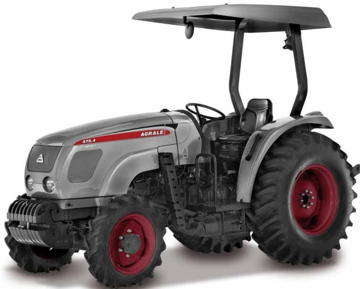
TRACTOR AGRALE 575.4 COMPACT