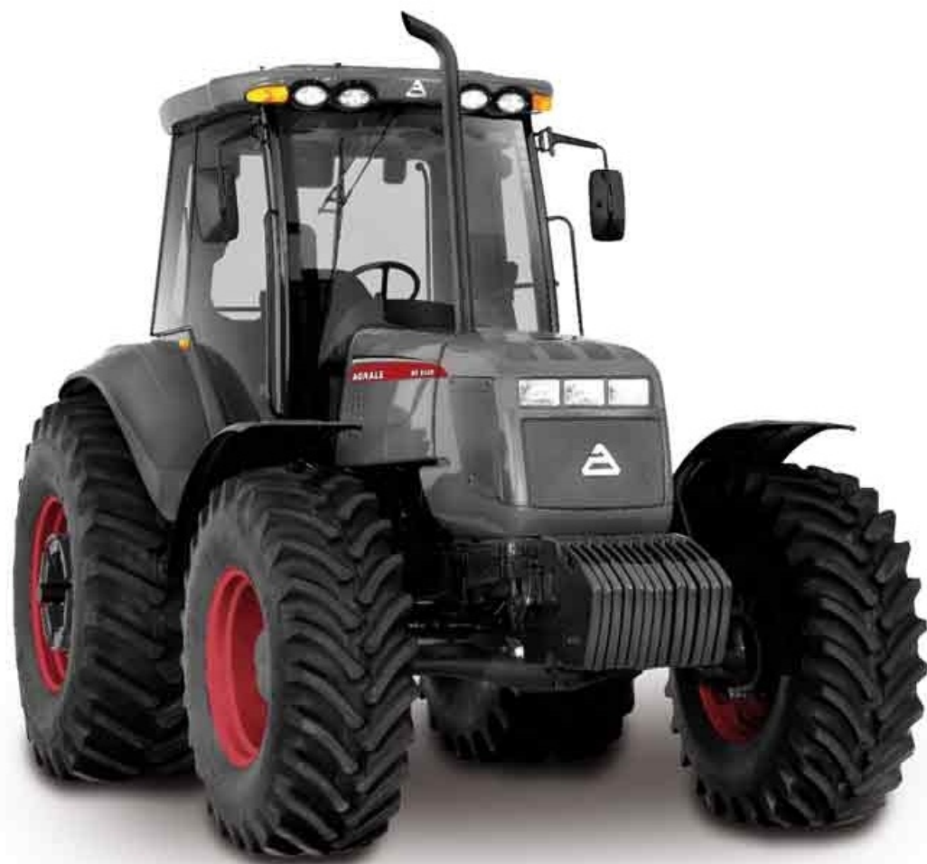
TRACTOR AGRALE BX 6180