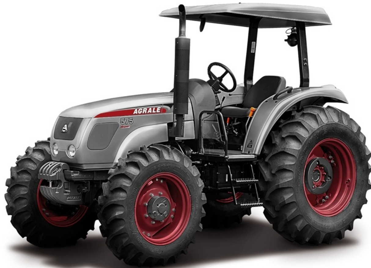
TRACTOR AGRALE 575.4