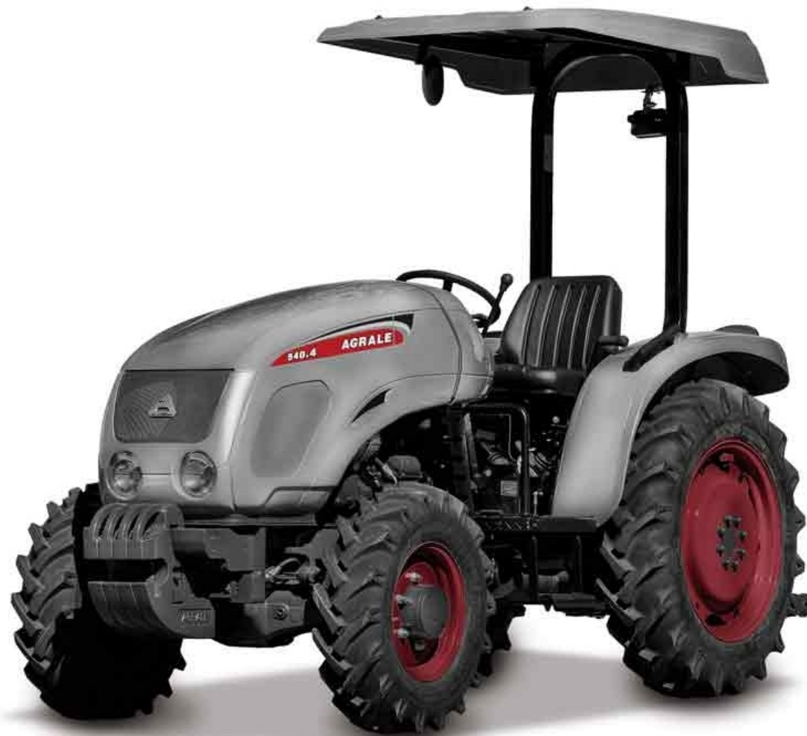
TRACTOR AGRALE 540.4