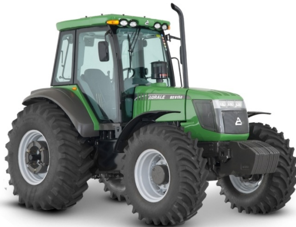
TRACTOR AGRALE BX 6150